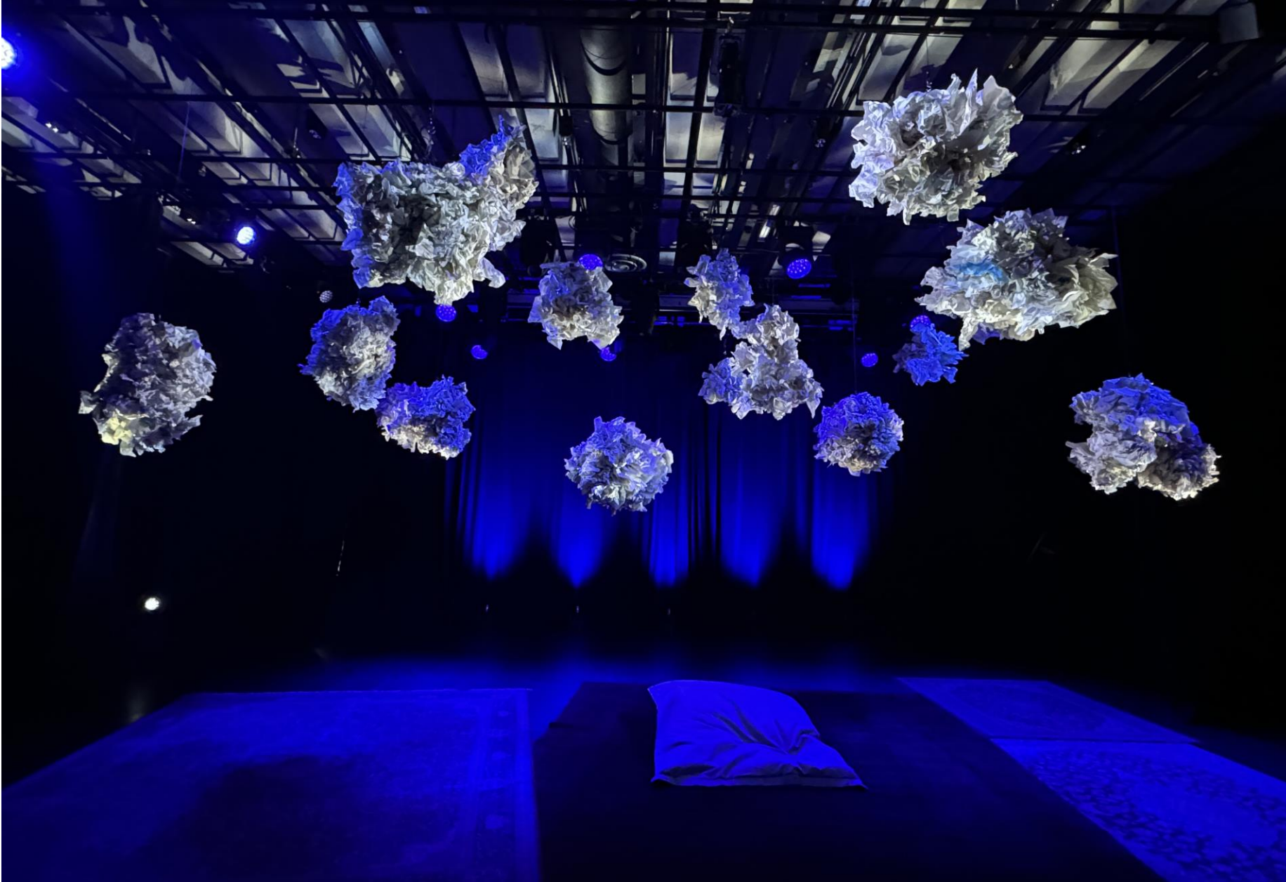
Utställning 2024 på Kulturhuset/Stadsteatern, Stockholm