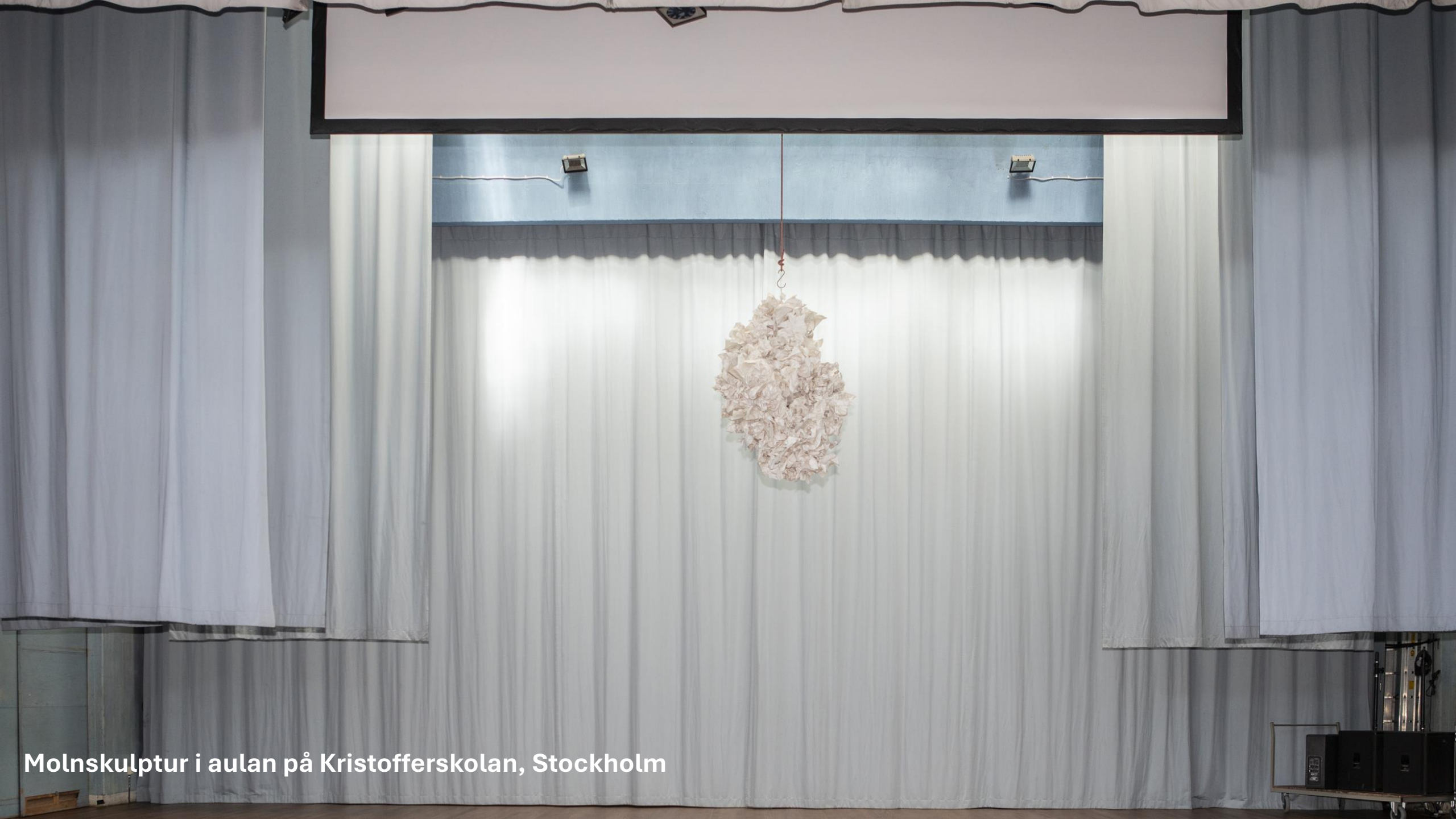
Molnsulptur i aulan på Kristofferskolan, Stockholm