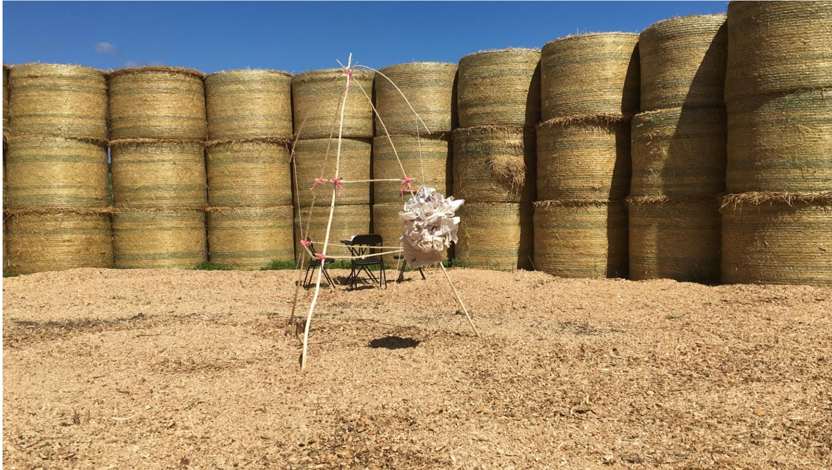
Molnsulptur, papper och trä, Rikstolvan. 2024